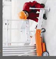
Outriggers with interlock