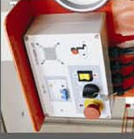
Ground control with outrigger LEDs