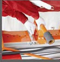
Adjustable pickup rail