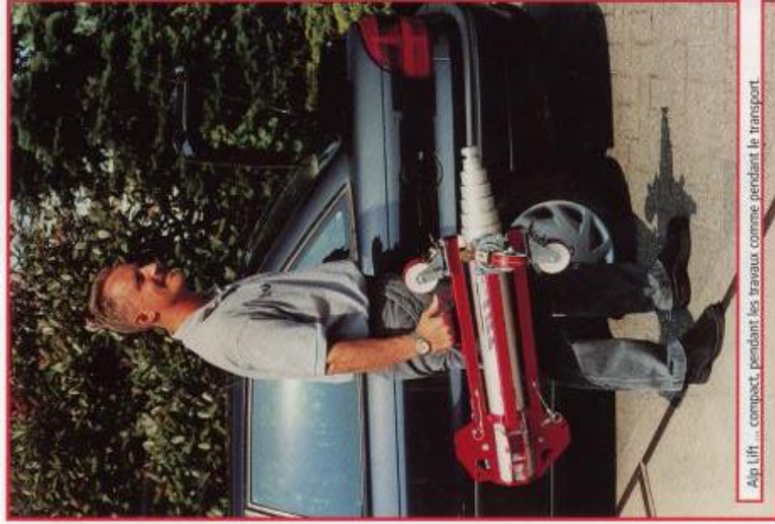
Alp Lift ... compact, pendant les travaux comme pendant le transport.